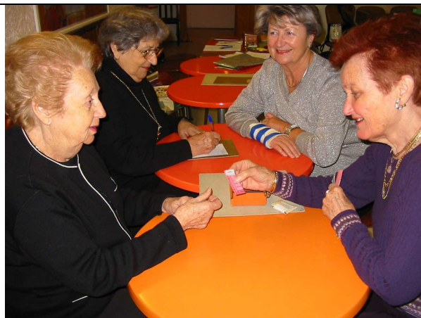
Les joueuses en pleine réflexion

LES JOYEUX RETRAITES 23 BLD DUBOUCHAGE 06000 NICE Tél : 04.93.80.49.44 ou 06.16.01.21.40