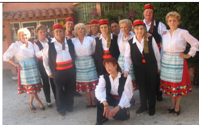
FETE DE LA MUSIQUE